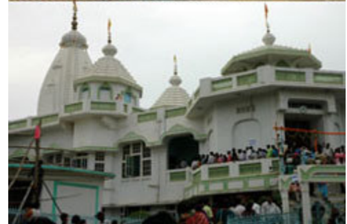
ଭୁବନେଶ୍ୱର ଇନ୍ଦନ ମଠରେ ଜନ୍ମାଷ୍ଟମୀ ।