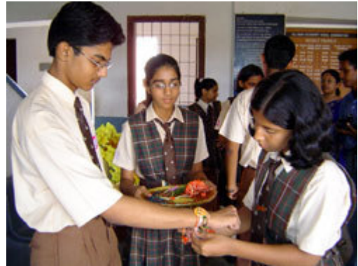
ଆଜି ପବିତ୍ର ରକ୍ଷା ବନ୍ଧନ...

ପ୍ରସ୍ତାବିତ ଆଇଆଇଏସର ଓଡ଼ିଶାରୁ ସ୍ଥାନାନ୍ତରଣ ନିଷ୍ପତ୍ତିକୁ ଏବିଭିପିର ବିରୋଧ ଭୁବନେଶ୍ୱର, (ଇମିସ): ଗତ ଏନ୍ତିଏ ସରକାର ସମୟରେ ଓଡ଼ିଶାରେ ସ୍ଥାପିତ ହେବାକୁ ଥିବା ଇଣ୍ଡିଆନ ଇନଷ୍ଟିଚ୍ୟୁଟ ଅଫ ସାଇନ୍ସ (ଆଇଆଇଏସ)କୁ ବର୍ତ୍ତମାନ କେନ୍ଦ୍ରର ଯୁପିଏ ସରକାର ଉଠାଇନେବାକୁ କରିଥିବା ଚକ୍ରାନ୍ତ ତଥା ଏପିନେଇ ରାଜ୍ୟ ସରକାରଙ୍କ ନୀରବତାକୁ ଅଖିଳ ଭାରତୀୟ ବିଦ୍ୟାର୍ଥୀ ପରିଷଦ ପକ୍ଷରୁ ତୀବ୍ର ନିନ୍ଦା କରାଯାଇଛି । ଏହା ବିରୋଧରେ ଆନ୍ଦୋଳନ କରାଯିବାକୁ ପରିଷଦ ତରଫରୁ ନିଷ୍ପତ୍ତି ନିଆଯାଇଛି । ଓଡ଼ିଶାରେ ଏକ କେନ୍ଦ୍ରୀୟ ମାନ୍ୟତାପ୍ରାପ୍ତ, ସମ୍ମାନଜନକ ଇଣ୍ଡିଆନ ଇନଷ୍ଟିଚ୍ୟୁଟ ଅଫ ସାଇନ୍ସକୁ ଭୁବନେଶ୍ୱର ଠାରେ ସ୍ଥାପନ କରିବା ପାଇଁ ତତ୍କାଳୀନ କେନ୍ଦ୍ର ମାନବ ସମ୍ବଳ ବିକାଶ ମନ୍ତ୍ରୀତ. ମୁରଲୀ ମନୋହର ଯୋଶୀ ଘୋଷଣା କରିଥିଲେ ଏବଂ ନବମ ଅର୍ଥ କମିସନ୍ ମଧ୍ୟ ଏଥିପାଇଁ ୫୦ କୋଟି ଟଙ୍କା ମଞ୍ଜୁର କରିଥିଲେ । ଏହି ପ୍ରତିଷ୍ଠାନ ପାଇଁ ଓଡ଼ିଶା ସରକାର ଭୁବନେଶ୍ୱର ଉପକଣ୍ଠରେ ୨୫ ଏକର ଜମି ମଧ୍ୟ ଯୋଗାଇ ଦେଇଥିଲେ । ମାତ୍ର କେନ୍ଦ୍ରରେ ଯୁପିଏ ସରକାର ଆସିବା ପରେ ଭୁବନେଶ୍ୱରରେ ସ୍ଥାପିତ ହେବାକୁ ଥିବା ଏହି ପ୍ରତିଷ୍ଠାନକୁ ଅନ୍ୟତ୍ର ସ୍ଥାନାନ୍ତରିତ କରିବା ପାଇଁ ଯୋଜନା କରିଛନ୍ତି । ଯୁପିଏ ସରକାରର ଏହି ଓଡ଼ିଶା ବିରୋଧୀ ନୀତିକୁ ଏବିଭିପି ତୀବ୍ର ବିରୋଧ କରିବା ସହିତ ଏଥିପାଇଁ କେନ୍ଦ୍ର ପୁନଃ ବିଚାର କରିବା ଏବଂ ରାଜ୍ୟ ସରକାର ଏପିନେଇ ଚାପ ସୃଷ୍ଟି କରିବା ପାଇଁ ଦାବି କରିଛି । ଏହା ନ ହେଲେ