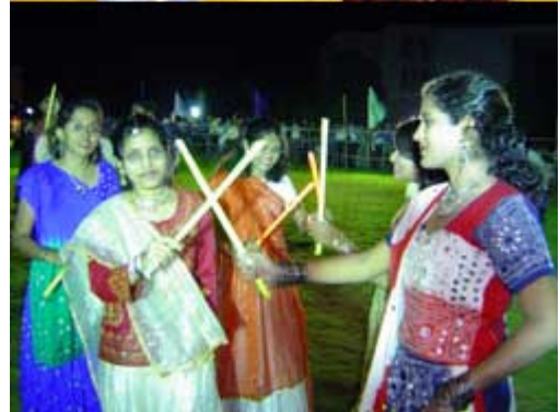
ଭୁବନେଶ୍ୱରରେ ଦାଣ୍ଡିଆ....ନବରାତ୍ରୀ ଉତ୍ସବ ପାଇଁ କିଟ୍ସ ଓ ଏକ ତାରକା ହୋଟେଲରେ ଦାଣ୍ଡିଆ ନୃତ୍ୟ ।